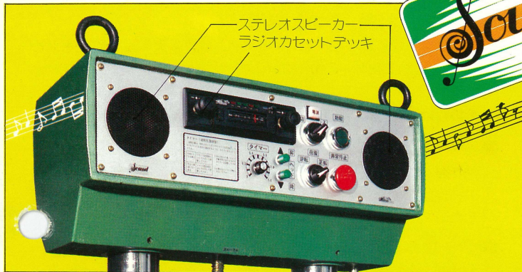
ステレオスピーカー ラジオカセットデッキ