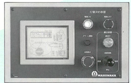
●液晶パターン記憶タッチパネル操作盤 (オプション、定寸位置決め装置付の場合)