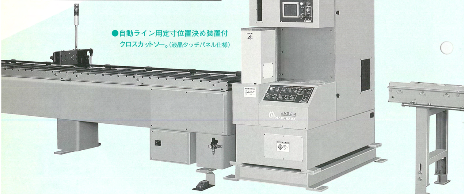
●自動ライン用定寸位置決め装置付 クロスカットソー。(液晶タッチパネル仕様)