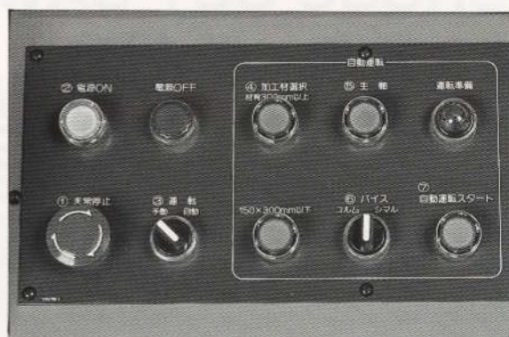
●操作性に優れた操作パネル (標準機)