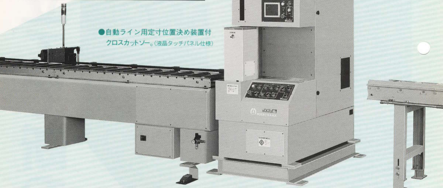
●自動ライン用定寸位置決め装置付 クロスカットソー。(液晶タッチパネル仕様)