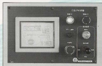
●液晶パターン記憶タッチパネル操作盤 (オプション、定寸位置決め装置付の場合)